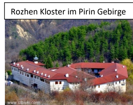
Rozhen Kloster im Pirin Gebirge