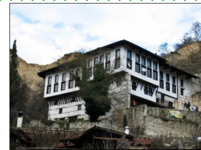
Melnik begrüßt mit seinem milden Klima und aromatischen

Es gelten die Allgemeinen Reisebedingungen.