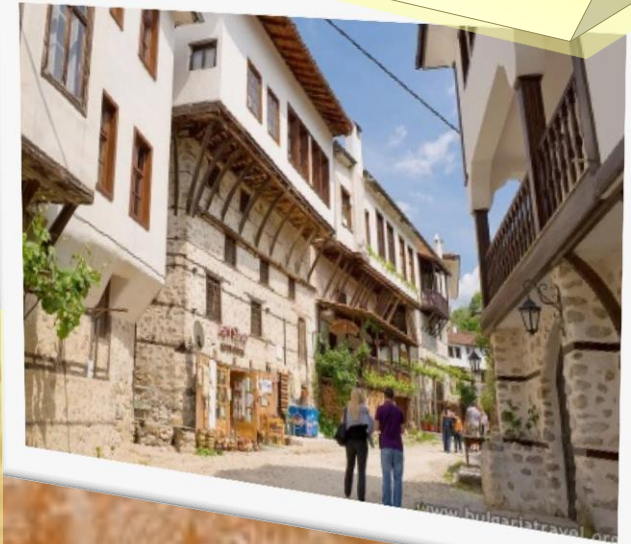
Die Straßen von Melnik

Eine faszinierende Reise mit gastronomischen und kulturellen Höhepunkten