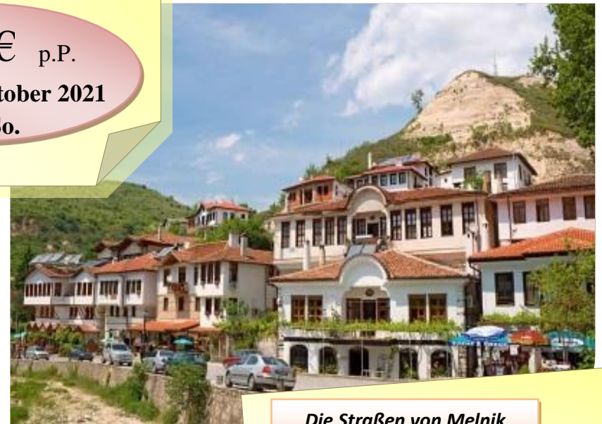
Die Straßen von Melnik